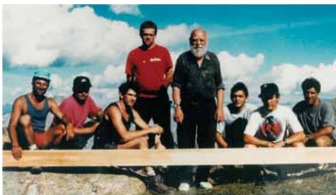
Saurez-vous les reconnaître ?

Le refuge du Sélé, quant à lui, construit par Ferdinand Bayrou en 1956 sur l'itinéraire d'Ailefroide ou du Pic Sans Nom a été restauré en 2000 par la même équipe à deux exceptions près. Six jours de travail sur un piton rocheux à 2710 mètres d'altitude et dans les pires conditions climatiques (pluie, froid et neige) ont ainsi permis de sauve-