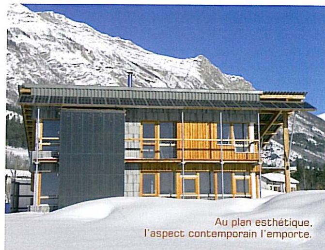
Au plan esthétique, l'aspect contemporain l'emporte.

Le garage a été déporté en bordure de voirie pour éviter l'évacuation manuelle de la neige sur voie privée.