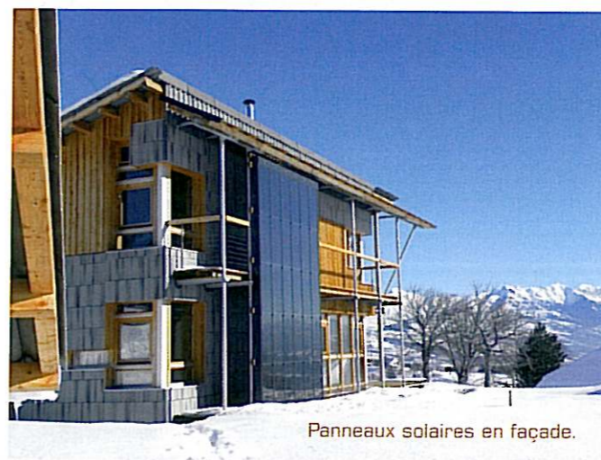
Panneaux solaires en façade.