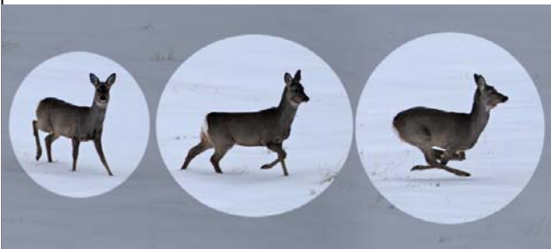
Avril 2008, Ceillac 05