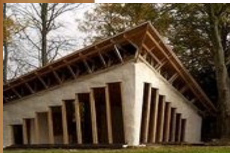
chantier Steen Moller

Thèmes - la paille porteuse - la pré-fabrication et filière sèche.