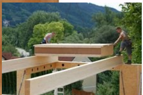
Préfabrication Herbert Gruber